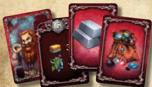
37 карт колоды Гномов