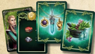
37 карт колоды Эльфов