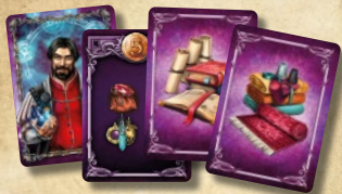
37 карт колоды Людей