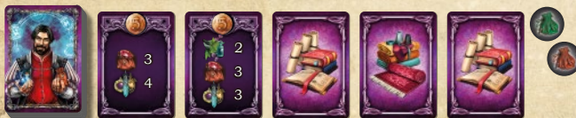
Подготовка к игре для 5 участников

Если больше половины карт в открытом ряду оказались картами покупателей, замешайте их обратно в колоду и заново выложите ряд.