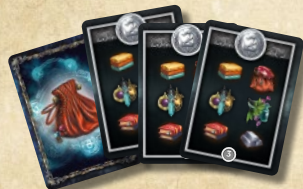
5 карт начального капитала