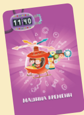
Карта машины времени

Если в игре используется карты для базового варианта (длительность кратная 15 минутам), то вам потребуются не все карты «машины времени», а только те, на которых минутный счётчик показывает «:00», «:15», «:30», «:45».