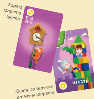
Карта со значком отмены запрета