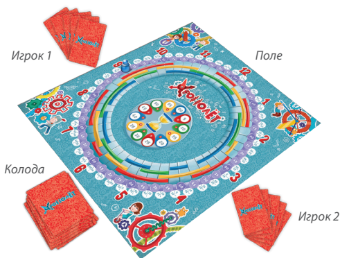
Начало игры, раздача

Цель игроков — выполнить больше всех дел в течение игры. Игроки ходят по очереди, по часовой стрелке. Первым ходит тот, кто сегодня встал раньше всех :)